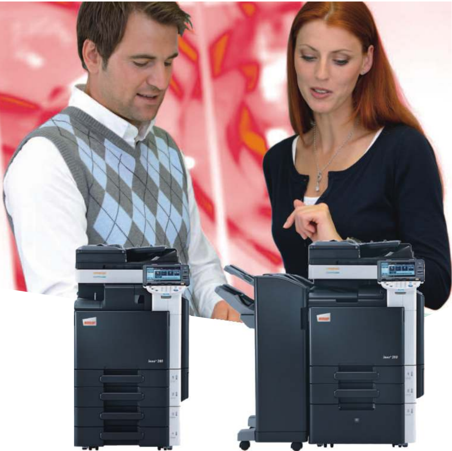
ineo+ 280 con alimentador de documentos (DF-617) con finalizador integrado (FS-529) y pedestal con 2 bandejas universales de 500 hojas (PC-207)