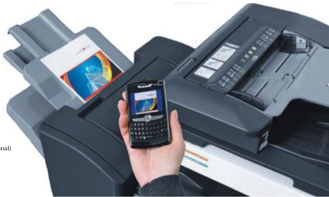
Impresión desde móvil por conexión blutetooth (Opcional)