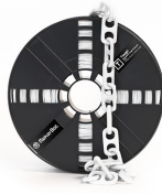
STONE WHITE 375-0008A