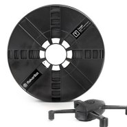
ONYX BLACK 375-0007A