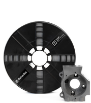
SLATE GREY MP06997