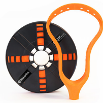
SAFETY ORANGE 375-0009A